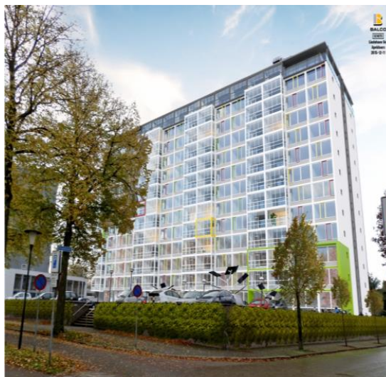
Impressie NOM-renovatie "De Lindenhove" in Apeldoorn